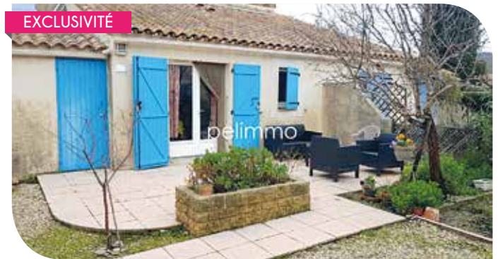
EXCLUSIVITÉ Eyguières 147 000 € * Maison dans résidence sécurisée avec piscine. Au Rdc, salon donnant sur une kitchenette, une chambre, salle de bains avec wc. A l'étage, vous disposez d'une seconde chambre en mezzanine. A l'extérieur, une terrasse un joli jardin clos et un cabanon et un abri de jardin ; parking privatif. Réf. 11163 - DPE : E PELIMMO 04 90 57 02 09