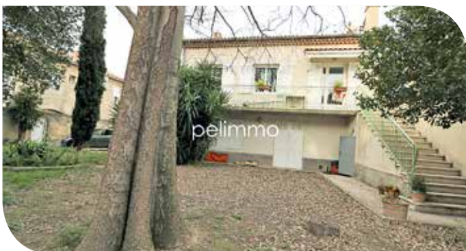
Miramas 399 000 € * Maison 6 pièces 160 m 2 à 2 pas du centre ville au calme, jolie maison de ville sur 2 niveaux. Au premier, une cuisine équipée, un salon-séjour, 3 chambres et des wc séparés. Au rez-de-chaussée, une chambre avec sa salle d'eau, une buanderie et 2 pièces aménagées en chambre. Grand jardin arboré. Réf. 1121 - DPE : D PELIMMO 07 81 29 81 56