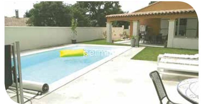
Lamanon 440 000 € * Agréable maison récente de 120m 2 hab. en plain pied, hors lotissement, sur 611m 2 de terrain plat. Grande pièce de vie avec cuisine américaine équipée, 4 chambres, salle d'eau; piscine avec pool house et remise. Véritable havre de paix, la maison vous séduira par ses prestations de qualité ; poêle à granulés, forage. Disponible mi août 2020. Réf. 11131 - DPE : C PELIMMO 04 90 57 02 09