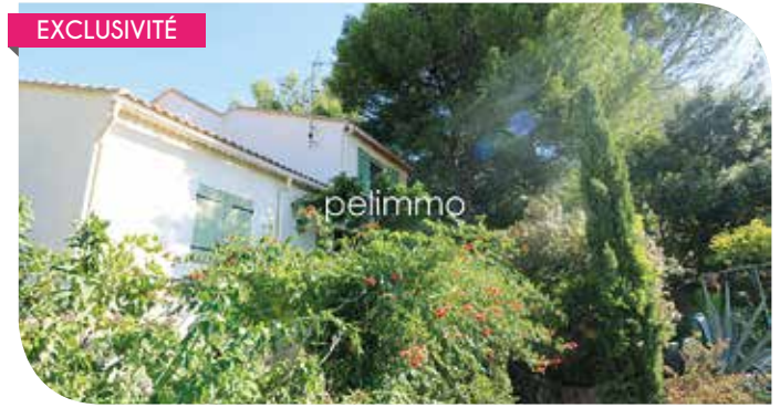
EXCLUSIVITÉ Lamanon 331 000 € * Jolie maison 125m 2 hab dans un écrin de verdure au calme sans vis à vis sur terrain 820m 2 . Rdc, pièce de vie 35m 2 aménagée en séjour et SàM avec cheminée donnant sur véranda. Cuis aménagée fermée, 2 chs et 1 SdE. Etage, 2 chs et 1 SdE. S-sol, grand garage, buanderie et des dépendances. Vous serez charmés par son potentiel. aques travaux à prévoir. Réf. 10970 - DPE : D PELIMMO 04 90 57 02 09