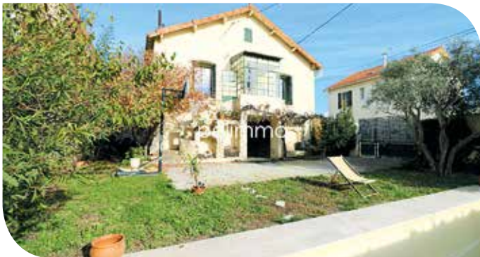
Miramas 300 000 € * Proche centre ville et au calme, charmante maison de ville de 140m 2 avec une grande pièce ouverte sur la cuisine à l'étage, 2 chambres, un bureau et un WC indépendant. Au rez-de-chaussée, 2 chambres, une grande salle de bain avec douche, un WC indépendant et un atelier de 23m 2 . Réf. 1124 - DPE : C PELIMMO 07 81 29 81 56