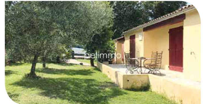
Alleins 470 000 € * Villa de plain-pied de 136 m 2 sur un joli terrain clos et arboré de 1300 m 2 au calme avec sa piscine sans vis à vis et en centre ville. Vous profiterez d'une cuisine aménagée donnant sur un séjour et une salle à manger de 47 m 2 ; la maison comprend aussi, 4 chambres, 1 salle de jeux, une salle de bains et une salle d'eau. Réf. 11092 - DPE : D PELIMMO 04 90 57 02 09