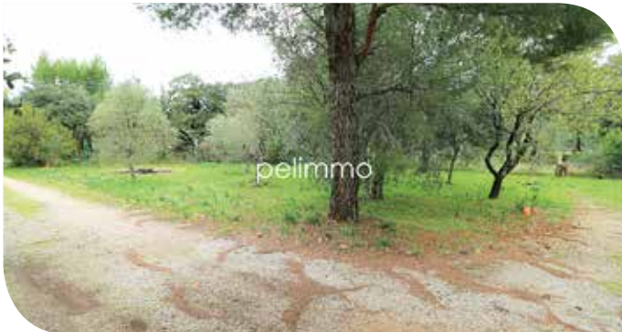
Aureille 193 000 € * Terrain plat et arboré de 605 m 2 . Viabilités à proximité. Libre constructeur. Réf. 1115 PELIMMO 06 19 98 28 87