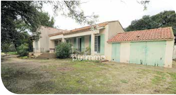
Aureille 270 000 € * Maison de plain-pied de 97 m 2 sur un terrain de 543 m 2 arboré. Une entrée, un séjour avec cheminée, une cuisine séparée, un vaste couloir desservant 3 grandes chambres et une salle de bains. 2 garages et une buanderie viennent compléter ce bien. Réf. 1114 - DPE : E PELIMMO 06 19 98 28 87