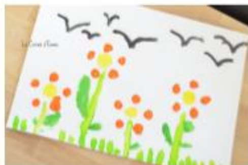
Et voici le résultat

Puis on fait l'herbe et les tiges. Vous pouvez arrêter là ou laisser votre enfant finir de compléter son paysage. Ma fille a choisi de faire des oiseaux par exemple.