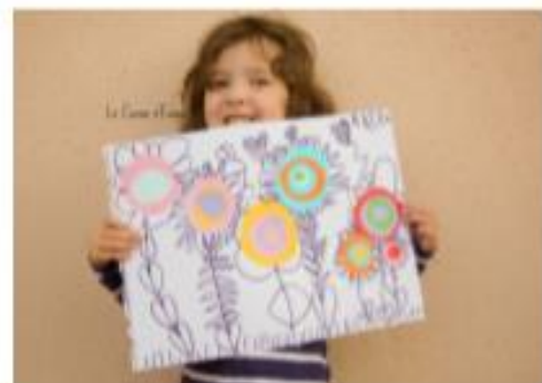
Et voici le résultat

Et pour finir on dessine les fleurs avec le feutre noir.